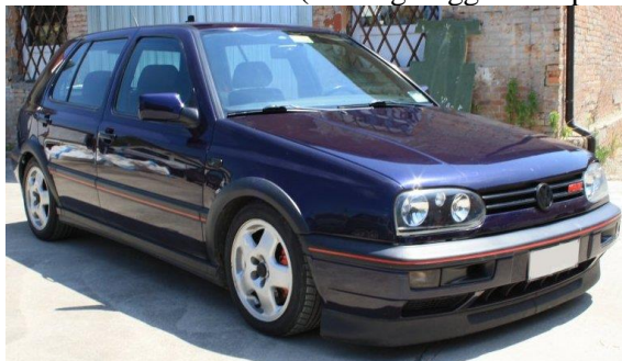
Vista 3/4 anteriore lato destro (con targa leggibile se presente)

I veicoli cabriolet o con hard-top dovranno essere fotografati con capote aperta e chiusa