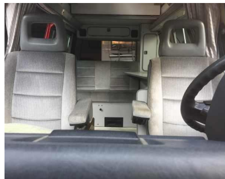
foto del vano di carico o dei posti scattata dal portellone laterale

foto del vano di carico o dei posti scattata internamente verso dietro