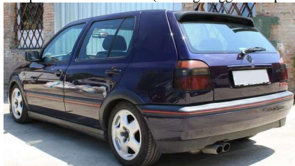
Vista 3/4 posteriore lato sinistro (con targa leggibile se presente)

I veicoli cabriolet o con hard-top dovranno essere fotografati con capote aperta e chiusa