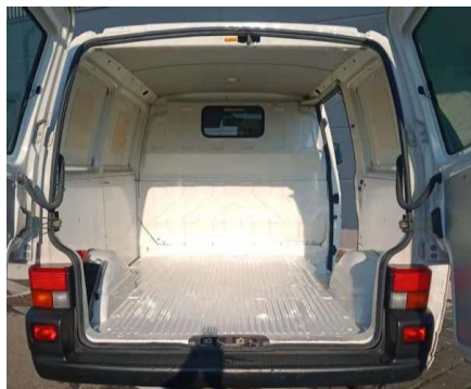
foto del vano di carico o dei posti scattata internamente verso dietro

foto del vano di carico o dei posti scattata internamente verso davanti